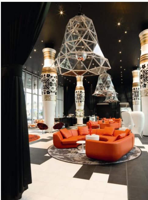
Marcel Wanders, The Kameha Grand Bonn Hotel, Bonn, 2010.

Een bekende uitspraak: 'Less is more'. Marcel Wanders zegt: 'Meer is meer!' 15 Wat vind jij? Mag het wel iets minder, om één ding sterker te laten uitkomen, of ben je eens met Marcel Wanders dat het niet gek genoeg kan zijn?