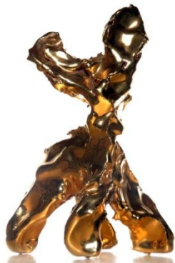
Marcel Wanders, One Minute Sculpture , 2004.