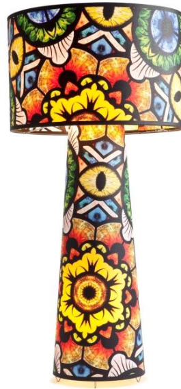
Marcel Wanders, Eye Shadow , 2013.