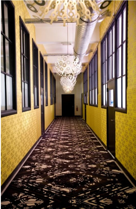
Marcel Wanders, Interieur Westerhuis, Amsterdam, 2008.

De interieurs die Marcel Wanders ontwerpt zijn vaak overweldigend, rijk gevuld met uitbundige patronen en objecten 14 . Kijk bijvoorbeeld maar eens naar de onderstaande interieurfoto's.