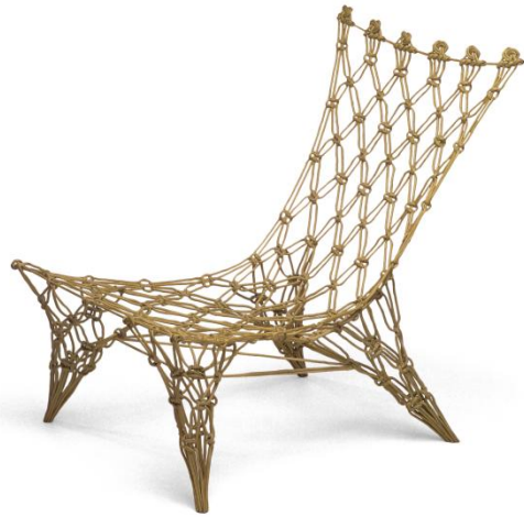
Marcel Wanders, Knotted Chair (prototype no. 5), 1995-1996, Collectie Stedelijk Museum Amsterdam.

Marcel Wanders werd beroemd met zijn ontwerp van de Knotted Chair (1995-1996) - onder andere aangekocht door het Stedelijk en het MoMA - voor het ontwerpplatform Droog. Droog is opgericht om Nederlandse ontwerpers van Dutch Design* in het buitenland te promoten. Wie met Droog samenwerkt, maakt vaak functionele ontwerpen die tegelijkertijd een commentaar vormen op de hedendaagse cultuur. Wanders past helemaal in deze lijn, met zijn nadruk op het persoonlijke en de gevoelswaarde van een object. Zoals de ontwerper in de uitzending zelf aangeeft, is 'vorm versus functie' een van de grote dogma's* in design.